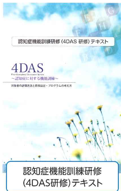
認知症機能訓練研修(4DAS研修)テキスト