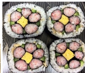
写真はいずれもイメージです