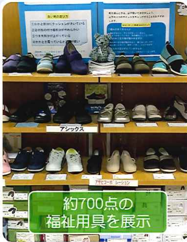
約700点の福祉用具を展示

「すこやかセンター」は、介護予防や自立支援、介護の負担を軽減する福祉用具の展示、リハビリの専門職による介護等に関する相談を通して、但馬地域の高齢者等が健やかに安心して暮らせる環境づくりを支援しています。