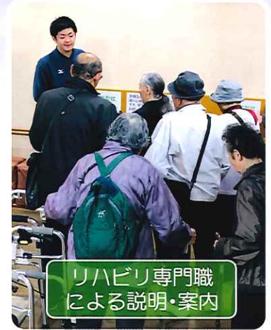
リハビリ専門職による説明・案内